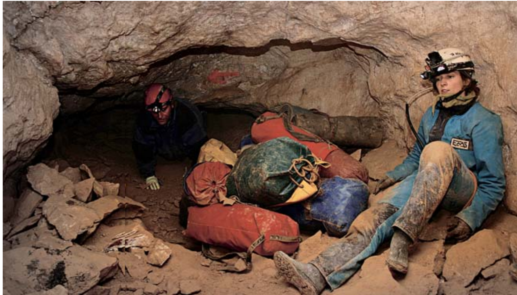
GRAFIKEN: TU DRESDEN ZIH (HETZE/GEISLER), IFK

Stephan Schön ist Wissenschaftsredakteur der Sächsischen Zeitung. □